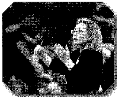
L. VAN BEETHOVEN (1770 - 1827)