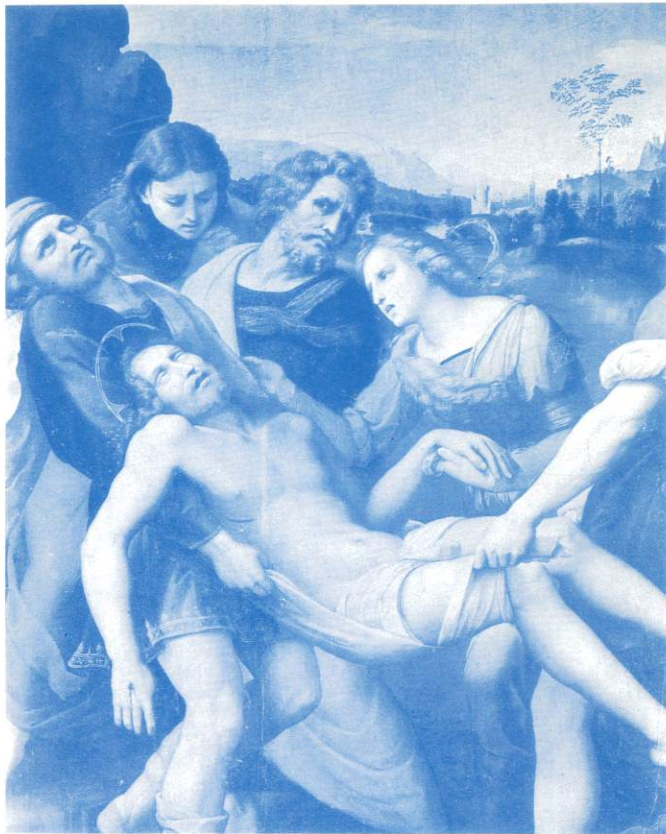
LA DEPOSIZIONE (Raffaello)

Coordinamento artistico: Associazione MUSICA RARA Tel. 035/22.20.53