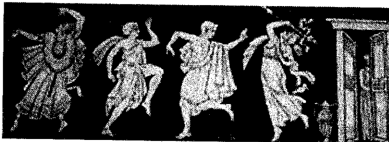
Fregio nell'Atrio del Teatro alle Grazie